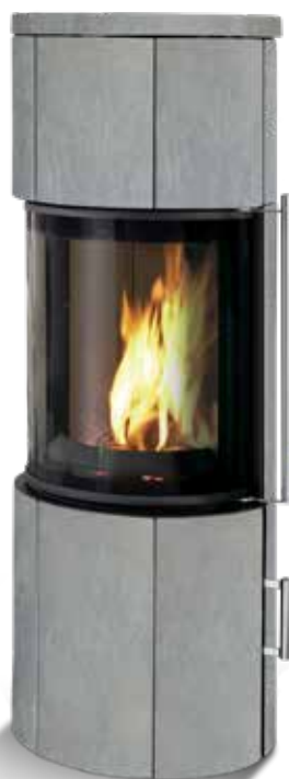
Korpus schwarz | Speckstein