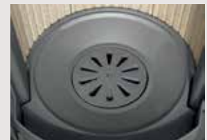
Massiver Gussboden mit Drehrost