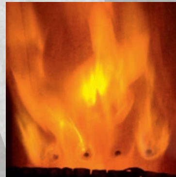
Tertiärluft wird durch Düsen im hinteren Brennraumbereich „eingeblassen“

Zusätzlich oder parallel zur Sekundärluft wird den Brennräumen mancher Öfen noch Tertiärluft durch spezielle Düsen im hinteren Brennraumbereich zugeführt. Dies dient einer weiteren Verbesserung der Vermischung von Brenngas und Luft in der Vollbrandphase.